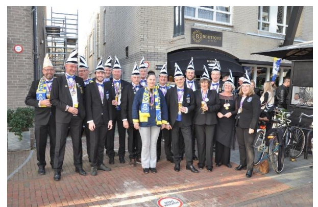
De Raad van elf tijdens het kennismaken met de huidige Prinsenvaren

De carnavaleske groet van de raad van elf.